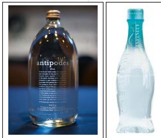
ภาพที่ 3 แสดงลักษณะบรรจุภัณฑ์ของน้ำยี่ห้อต่างๆ ที่เข้าร่วมการแข่งขัน