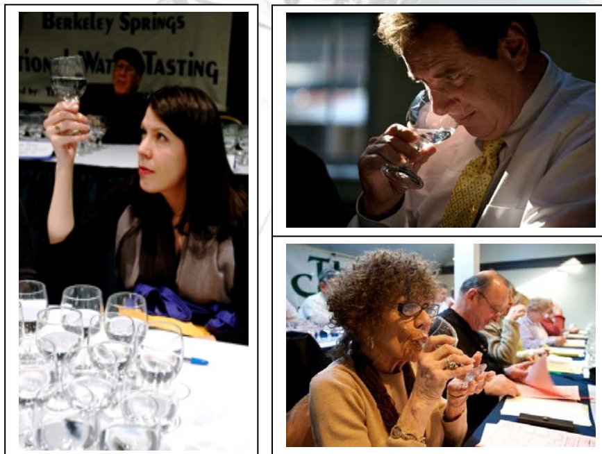
ภาพที่ 1 แสดงลักษณะวิธีการตัดสินทั้งการดู ดม และชิม

ในปีคริสต์ศักราช 2010 เทศกาลน้ำนานาชาติถูกจัดขึ้นระหว่างวันที่ 25-28 กุมภาพันธ์ แบ่งน้ำเข้าชิงชัยออกเป็น 4 ประเภท ได้แก่ น้ำประปา น้ำบรรจุขวด น้ำดื่มบริสุทธิ์ และน้ำอัดก๊าซ (sparkling water) นอกจากนี้ประเภท “People’s choice” ยังถูกเพิ่มเข้าไปในการแข่งขันด้วย โดยการแข่งประเภทนี้เป็นการแข่งแบบของบรรจุกิจภัณฑ์ สำหรับวิธีการตัดสินจะใช้วิธีการ ดู ดม และชิม แล้วให้เป็นคะแนน ซึ่งความเข้มงวดของทั้ง 3 วิธีเป็นหลักเกณฑ์เดียวกับการทดสอบคุณภาพของไวน์ ลักษณะที่มองดูยาดูต้องใสสะอาดอนุญาตให้ขุ่นได้เล็กน้อยถ้าเป็นน้ำที่ละลายมาจากน้ำแข็งธรรมชาติ ลักษณะที่ดมด้วยจมูกต้องไม่มีกลิ่นอันไม่พึงประสงค์ และลักษณะที่ลิ้มรสด้วยลิ้นต้องเป็นรสสะอาดอีกทั้งสัมผัสหลังดื่มต้องให้ความสดชื่น โดยการตัดสินน้ำที่ส่งเข้าแข่งขันทั้งหมดจะใช้เวลามากกว่า 2 วัน สำหรับผู้ตัดสินเป็นผู้เชี่ยวชาญด้านรสชาติของน้ำ ซึ่งในครั้งนี้ได้รับเกียรติจากนาย อาเธอร์ ฟอน ไวเซนแบร์เกอร์ ผู้ก่อตั้งเว็บไซต์ BottledWaterWeb.com เข้าร่วมเป็นคณะกรรมการผู้ตัดสินด้วย สำหรับผลการตัดสินในปีนี้ออกตัวอย่างประเภทน้ำประปาและบรรจุกิจภัณฑ์ซึ่งมีผลการตัดสินดังนี้